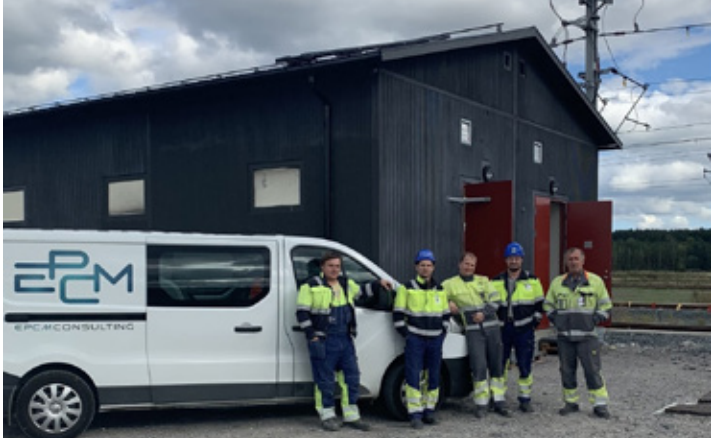
Команда EPCM Consulting OÜ.