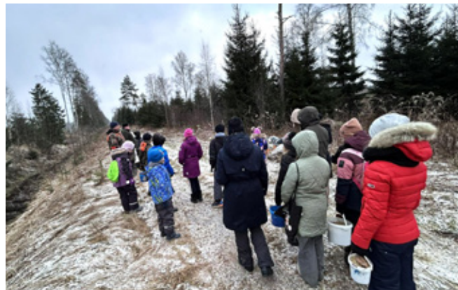
Охотничьем доме изучали диких животных и их следы.

Вечером жарили на гриле, пили горячий чай и ели торт. Хорошее настроение создавали охотничьи собаки Хаана и Минни.