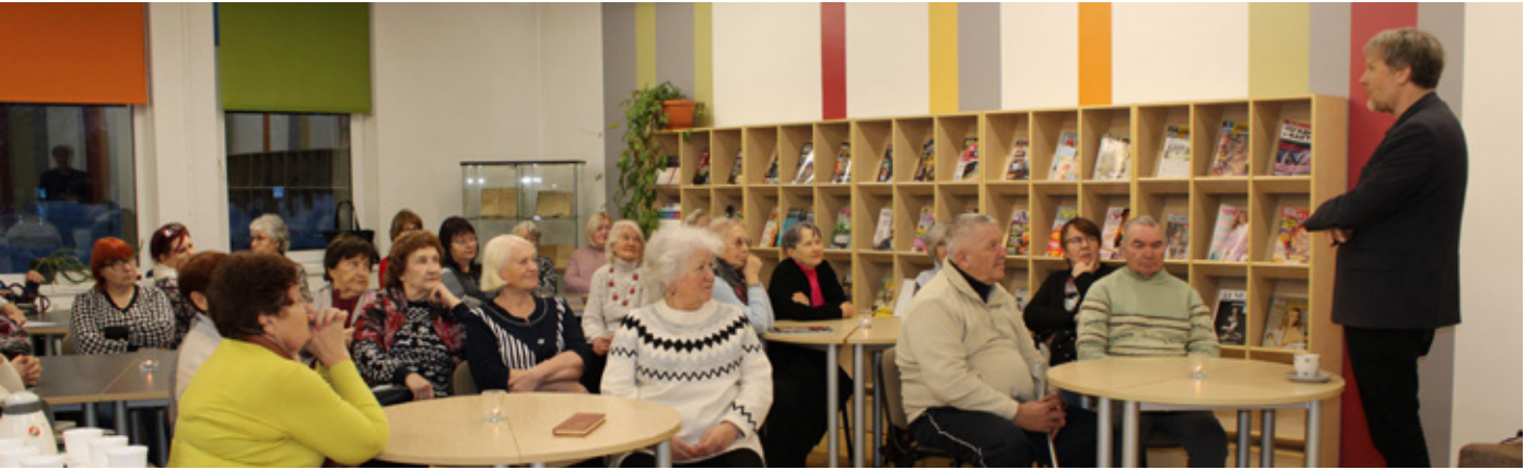
Фото: архив библиотеки