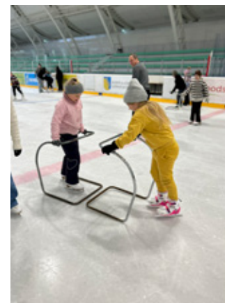
Катание на коньках в ледовом холле.

Понравился и мастер-класс по лепке из глины под руко-