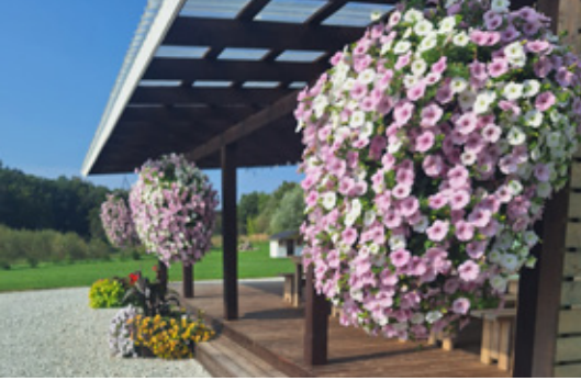
Подвесные цветочные композиции на террасе винодельни, 2025 г.