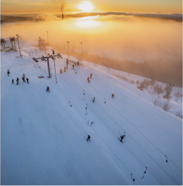
Вид на центр приключений.

Компания работает уже 10 лет. Основные направления деятельности – сельское хозяйство и цветоводство. Также начато производство и продажа ягодных вин.