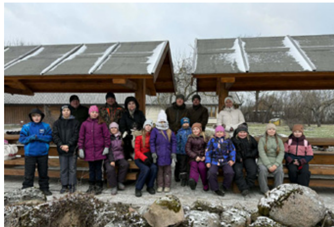
Поход в лес с охотниками Кивиыли.

В молодёжной комнате Кивиыли на каникулах готовили еду и мастерили ёлочные украшения в технике макраме. Интересной оказалась и прогулка по лесу вместе с охотниками Кивиыли, где каждый смог пополнить кормушки для животных и познакомиться с особенностями охотничьего дела. В