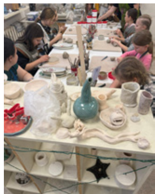
Мастерская по работе с глиной.