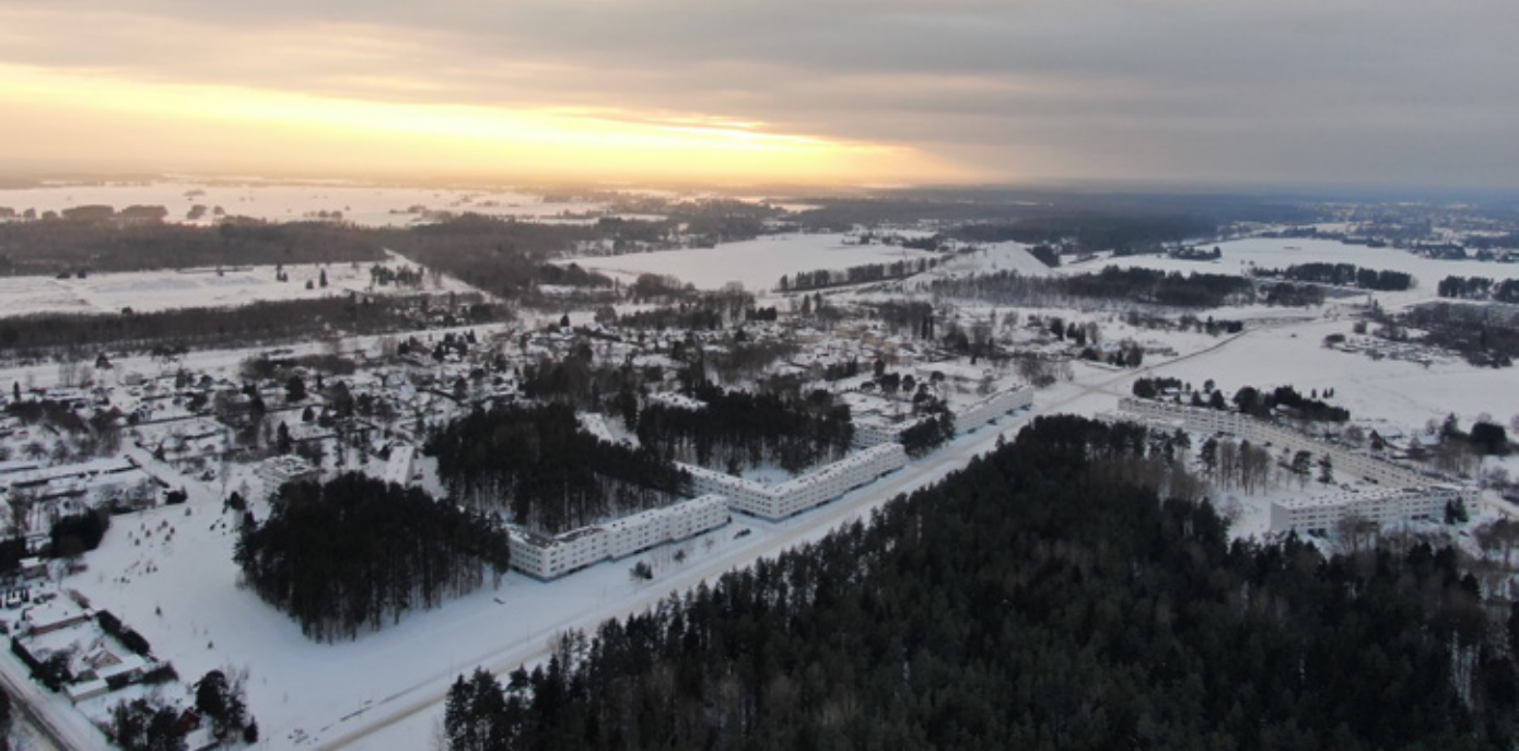
Вид на город Пюсси.