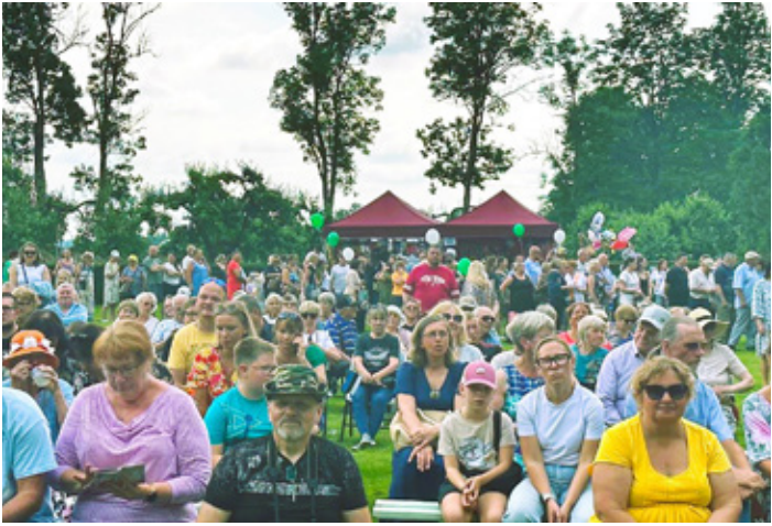
Фото с дня волости Люганузе, 2025 год.