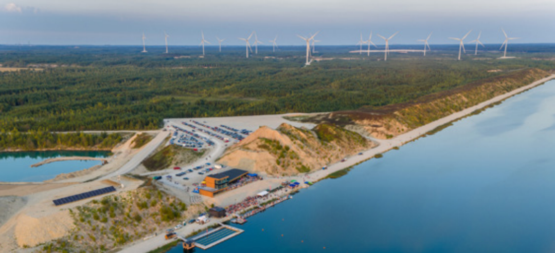
Центр Aidu.

Kiviõli Keemiatööstus — предприятие с более чем 100-летней историей. Основные направления деятельности включают добычу горючего сланца, а также производство сланцевого масла, тепловой и электрической энергии.